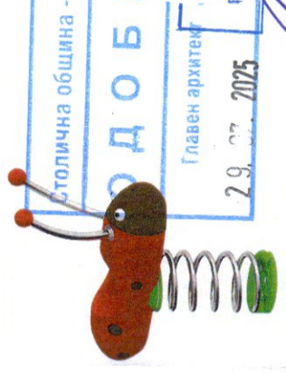
Клатушка (3-12 г.)