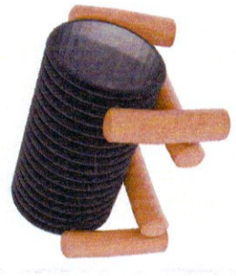
Тунел (0-3 г.)