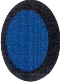
Съоръжение за подскачане (3-12 г.)