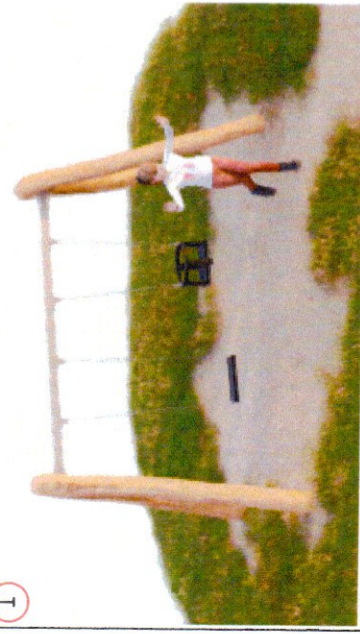
Люлка (0-12 г.)