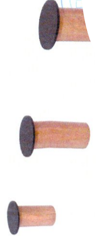
Пънчета за баланс (6+ г.)